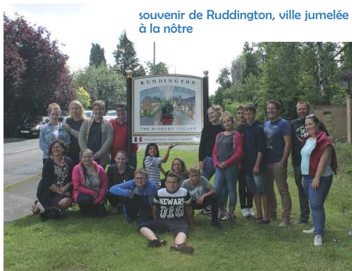
souvenir de Ruddington, ville jumelée à la nôtre

Enfin, dans le comté de Nottingham : visites de la forêt de Sherwood, du village museum, du musée de la laine et sur une exposition de dinosaures à Wollaton Park.