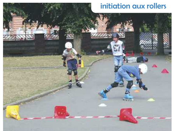
initiation aux rollers

Cette action a été soutenue par les bénévoles du monde associatif local, la ville, la Région et le Fonds d'Initiative des Habitants (F.I.H.).