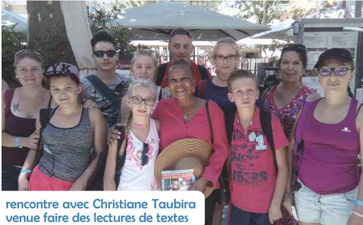
rencontre avec Christiane Taubira venue faire des lectures de textes

Dans le cadre de l'action « A la découverte du monde du spectacle », des jeunes du pôle médiathèque secteur jeunesse se sont rendus au festival pendant une dizaine de jours. Durant le séjour, ils ont découvert des spectacles dans tous les genres et pour tous les âges. L'objectif principal de leur présence était de retenir trois spectacles dont un sera à l'affiche de la programmation