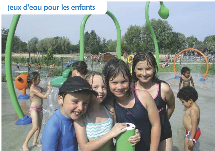
jeux d'eau pour les enfants

La manifestation a été soutenue par la municipalité et le CCAS.