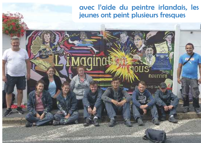
avec l'aide du peintre irlandais, les jeunes ont peint plusieurs fresques

Malgré la barrière de la langue, les jeunes ont tous adoré travailler avec un artiste international et ont très bien su se faire comprendre. Les jeunes, comme l'artiste, ont