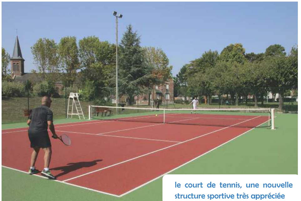
Le court de tennis, une nouvelle structure sportive très appréciée

résultats obtenus toute l'année dans la région et au-delà.