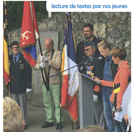
lecture de textes par nos jeunes