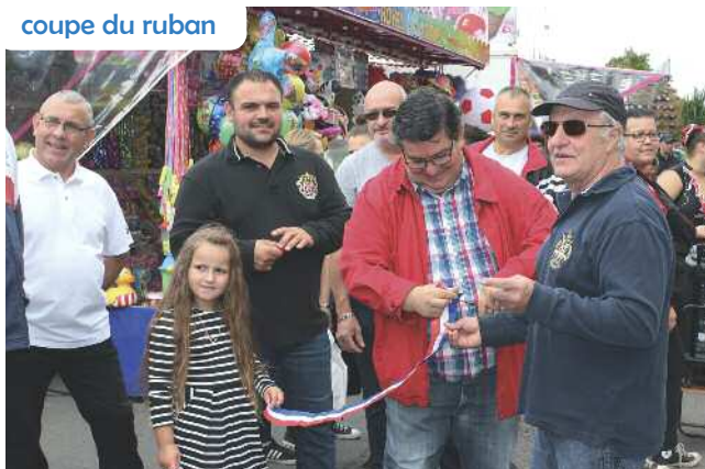
coupe du ruban

Organisée tous les ans avec les bénévoles de l'Avant-Garde de Grenay (AGG) et avec le soutien de la municipalité, la célèbre ducasse du 15 août a attiré de nombreux habitants cette année encore.