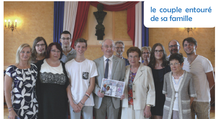
le couple entouré de sa famille

Il reprend son travail à la fosse puis est envoyé notamment à la fosse 3 de Lens à Liévin. C'est là qu'il vit le grave accident ayant eu lieu le 27 décembre 1974. Ce jour-là, il se porte volontaire comme secouriste pour venir en aide à ses collègues mineurs. Pour cette raison, la municipalité l'a élevé au rang de citoyen d'honneur de la ville en décembre 2012. Muté au 19 de Lens à Loos-en-Gohelle, il achève sa carrière professionnelle à la fosse 10