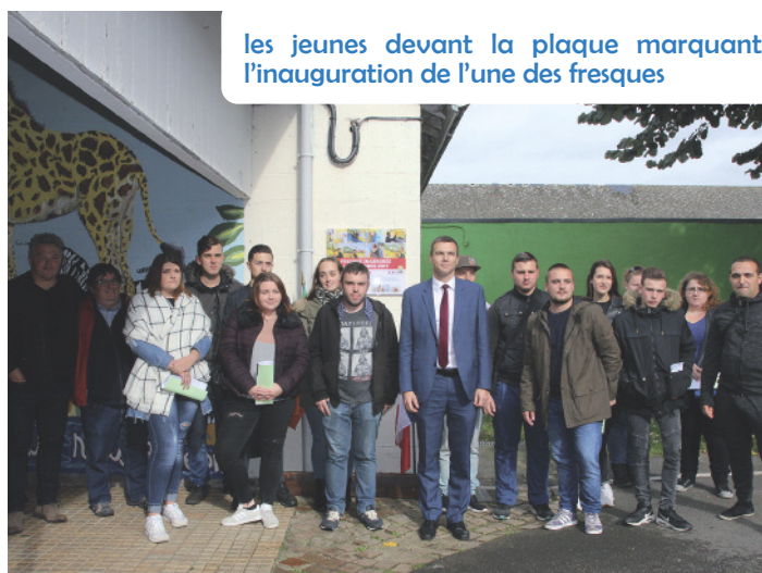
les jeunes devant la plaque marquant l'inauguration de l'une des fresques