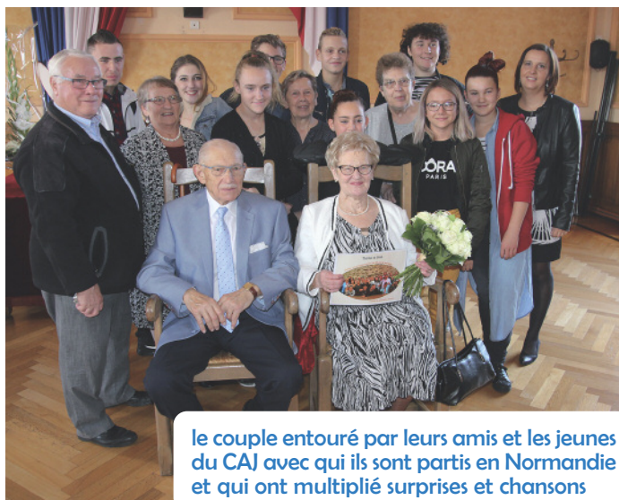
le couple entouré par leurs amis et les jeunes du CAJ avec qui ils sont partis en Normandie et qui ont multiplié surprises et chansons