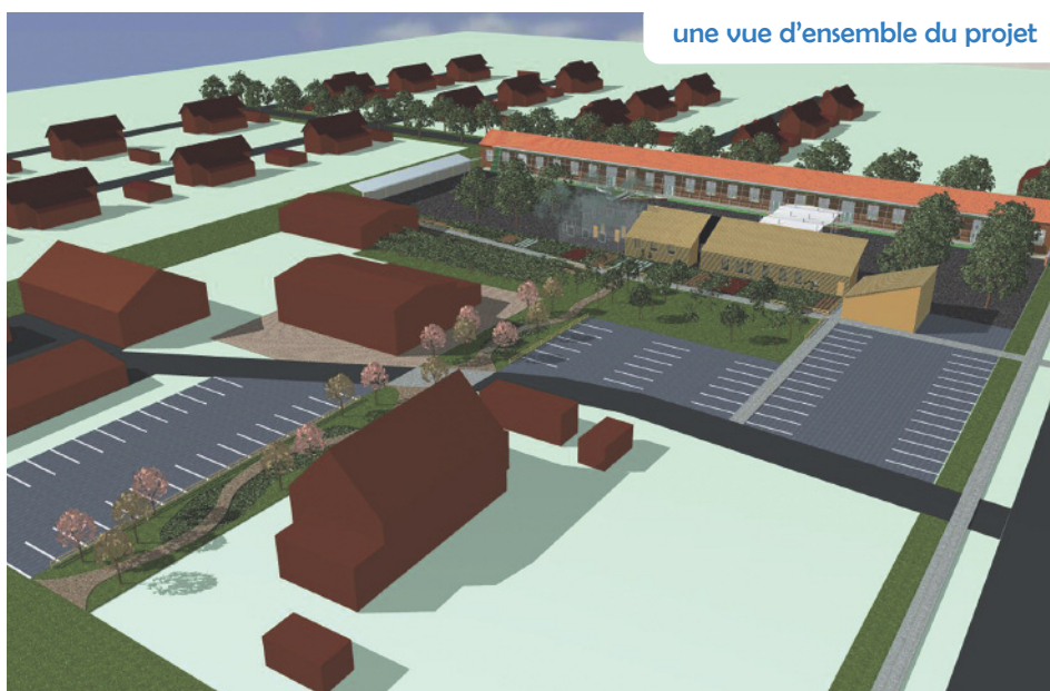
une vue d'ensemble du projet

Afin d'optimiser cette nouvelle contrainte, nous avons ajouté deux salles supplémentaires au projet initial qui en prévoyait deux, (une pour l'accueil périscolaire et une autre pour l'EPN, qui laissera sa place à une salle de classe dans le bâtiment même de l'école Buisson). Tout cela a fait qu'un nouveau dépôt de permis de construire a dû être réalisé, nous retardant dans les délais prévus, mais nous trouverons des solutions provisoires pour la rentrée 2018, si les travaux ne sont pas tout