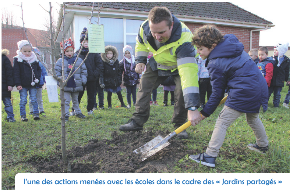
l'une des actions menées avec les écoles dans le cadre des « Jardins partagés »

2018 sera la continuation du travail engagé sur les jardins partagés afin de renouer les liens amicaux dans les cités et en même temps travailler sur la production locale et le bon usage des jardins. Ce sera la poursuite des actions menées pour l'amélioration du quotidien.