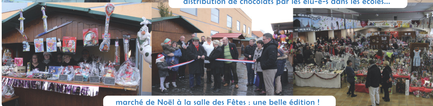
marché de Noël à la salle des Fêtes : une belle édition !