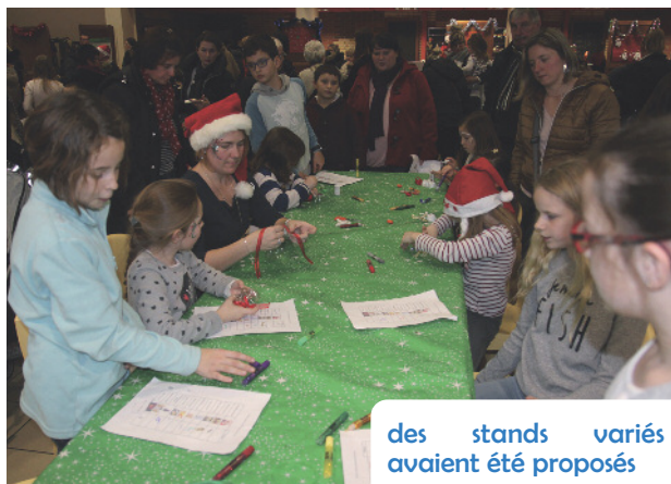
des stands variés avaient été proposés