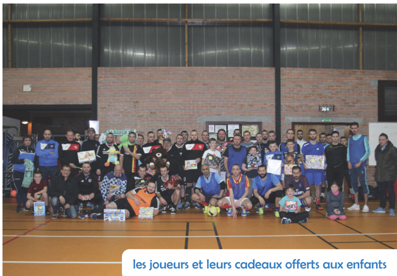
les joueurs et leurs cadeaux offerts aux enfants

A la salle des sports Yves-Delory, l'Union Sportive de Grenay (U.S.G.), l'un des clubs de football de notre ville, a organisé un tournoi. Des joueurs seniors de clubs différents se sont déplacés au bénéfice de l'A.L.C.E.S.E. (Association de Lutte Contre l'Exclusion Sociale et Economique).