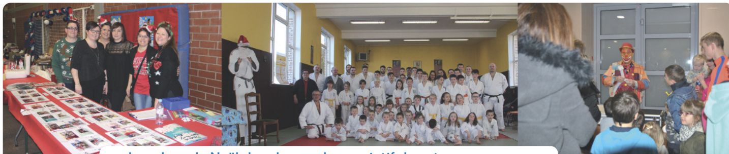
des arbres de Noël dans le monde associatif de notre commune...

Arbres de Noël associatifs, marché de Noël, distribution de friandises dans les écoles par les élu-e-s, votre journal vous propose un tour d'horizon de quelques unes des manifestations ayant eu lieu lors des fêtes de fin d'année.