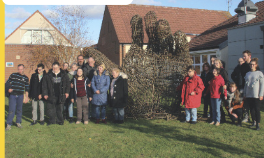
les résidents devant leur œuvre

Pour s'inscrire à cette manifestation, les footballeurs devaient ramener un jouet destiné à être offert à des enfants de notre ville. En présence de représentants de l'A.L.C.E.S.E., l'U.S.G. a pu offrir de nombreux cadeaux.