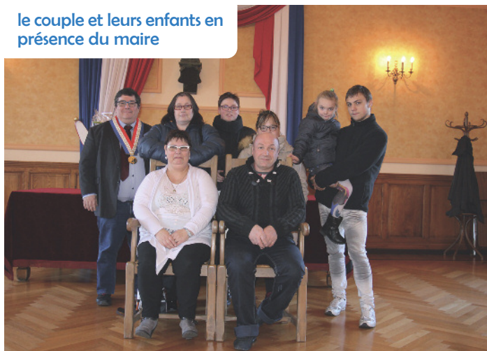
le couple et leurs enfants en présence du maire

dant des années puis change de métier en se consacrant à un emploi dans les espaces verts.