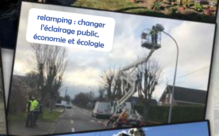
relamping : changer l'éclairage public, économie et écologie