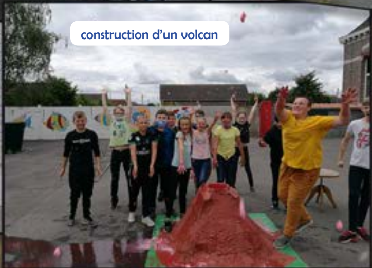
construction d'un volcan