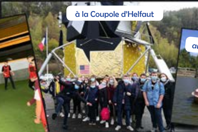
à la Coupole d'Helfaut