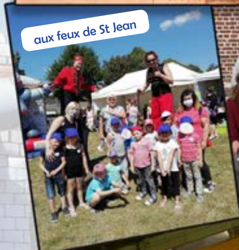
aux feux de St Jean