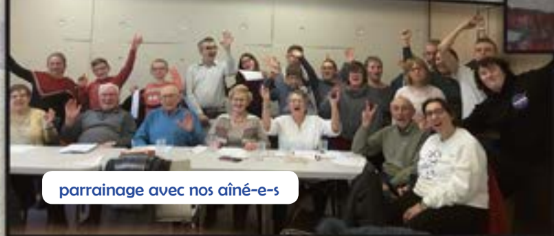
parrainage avec nos aîné-e-s