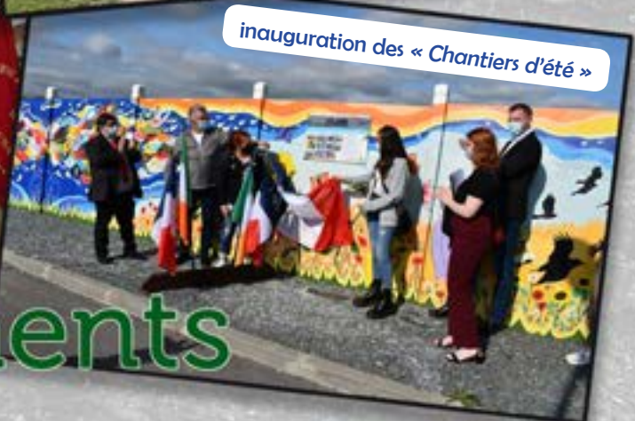
inauguration des « Chantiers d'été »