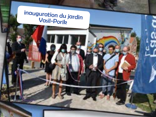
inauguration du jardin Vasil-Porik