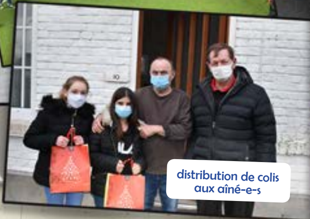
distribution de colis aux aîné-e-s