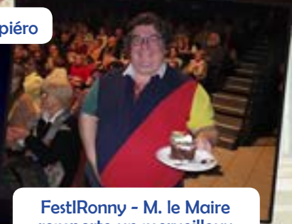
FestiRonny - M. le Maire remporte un merveilleux