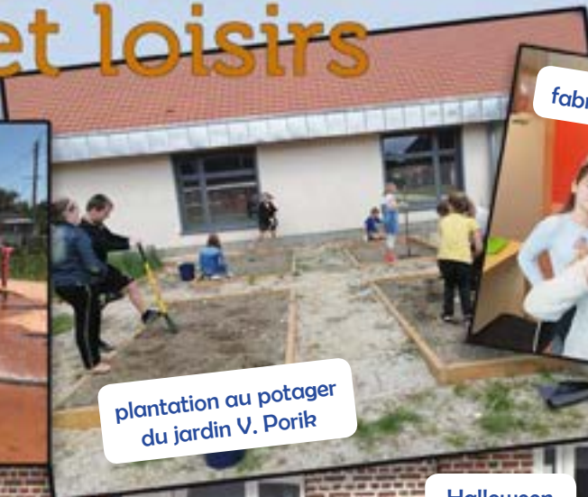
plantation au potager du jardin V. Porik