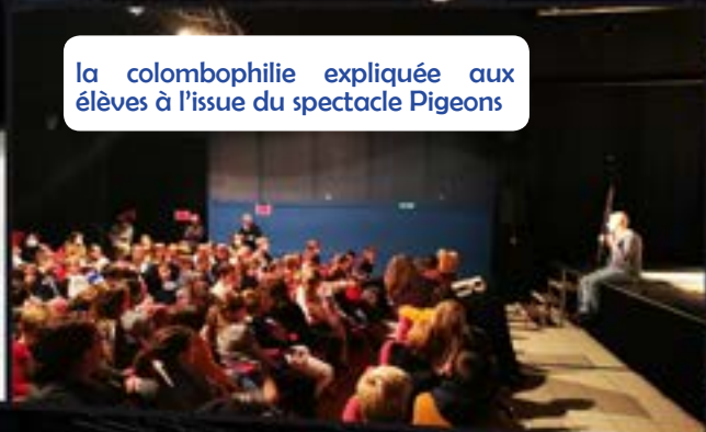
la colombophilie expliquée aux élèves à l'issue du spectacle Pigeons