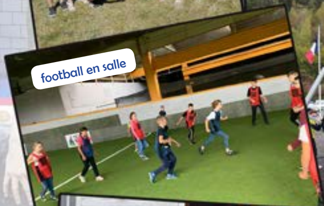
football en salle