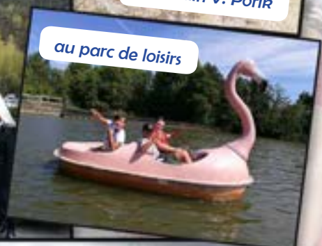
au parc de loisirs