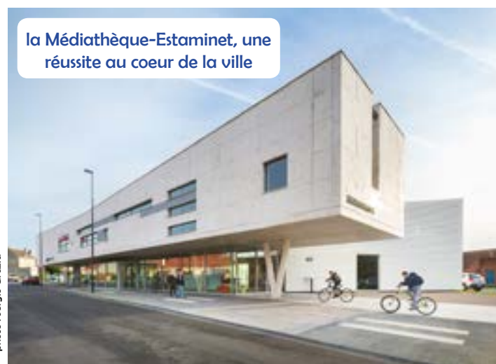
la Médiathèque-Estaminet, une réussite au cœur de la ville

Je tiens à vous rassurer sur les engagements de notre campagne municipale : dès que les conditions sanitaires le permettront, nous organiserons bien les réunions publiques nécessaires pour faire le point sur les difficultés ressenties par certains d'entre vous : la sécurité routière de manière générale avec les aménagements devant l'école Bince ou le stationnement et les sens uniques de la cité 40 par exemple.