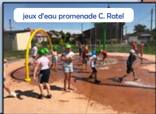
jeux d'eau promenade C. Ratel