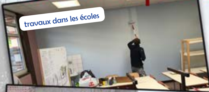
travaux dans les écoles