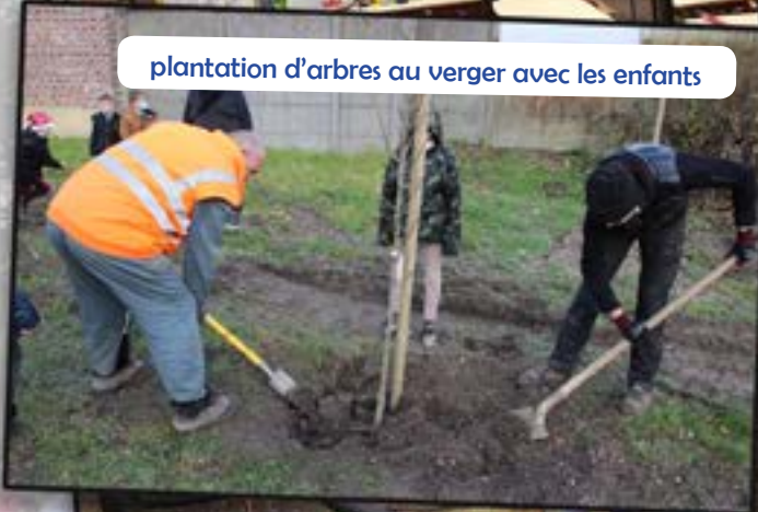
plantation d'arbres au verger avec les enfants