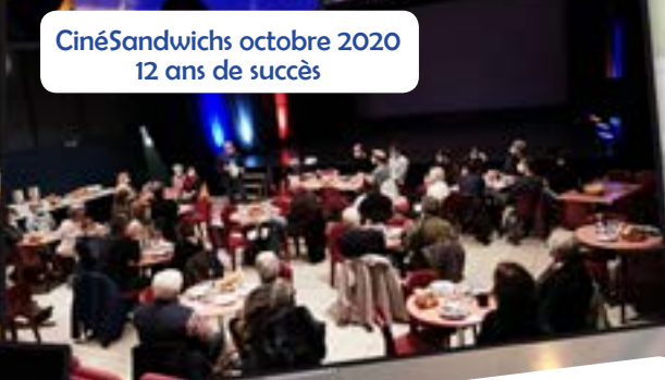
CinéSandwichs octobre 2020 12 ans de succès