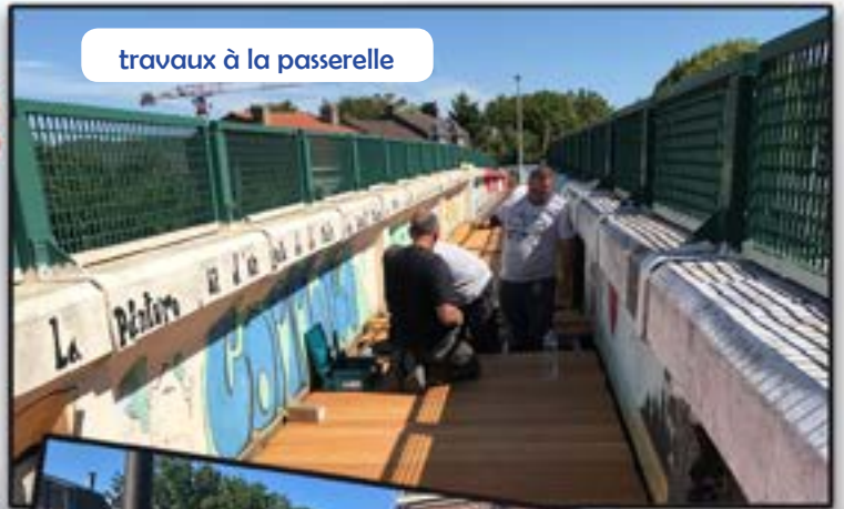
travaux à la passerelle