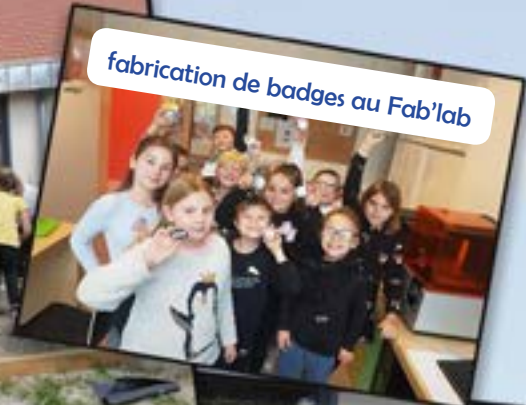
fabrication de badges au Fab'lab