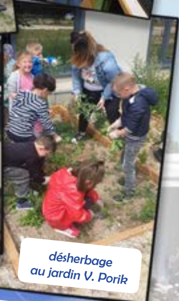
désherbage au jardin V. Porik