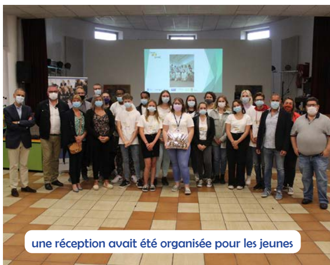
une réception avait été organisée pour les jeunes

Action d'éducation à la citoyenneté par l'entrepreneuriat coopératif et à l'économie solidaire, la coopérative a permis à 16 jeunes de 16 à 18 ans de proposer leurs services à des particuliers ainsi qu'à des mairies (travaux de jardinage...) contre une rémunération. Encadrée par deux animateurs qui ont bénéficié d'une formation à cette occasion, la micro-entreprise a permis aux jeunes d'appréhender le monde du travail. Les jeunes dont certains habitent notre