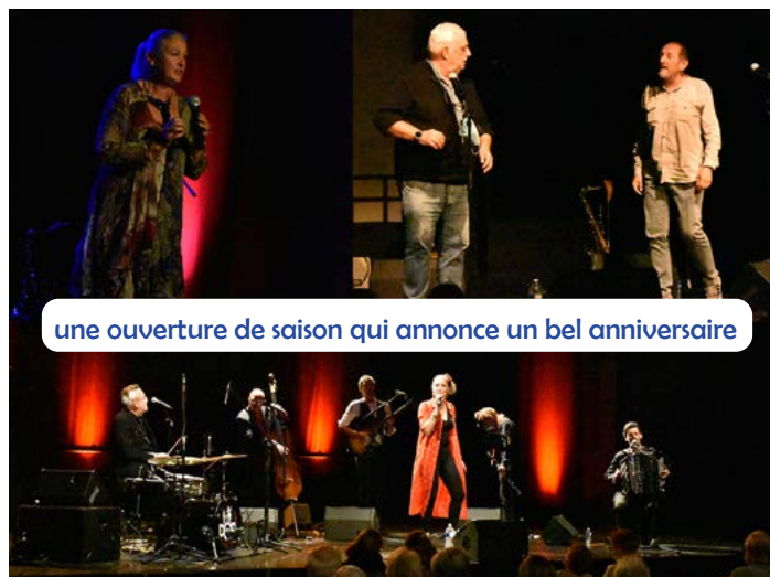
une ouverture de saison qui annonce un bel anniversaire

Les pâtisseries de la ville ont régalé nos papilles en montrant leur savoir-faire pour l'occasion car, bien sûr, on ne fête pas un anniversaire sans offrir de gâteaux ! Les amoureux du chocolat ont aussi eu la surprise de repartir avec les délicieuses moustaches de Ronny confectionnées par la