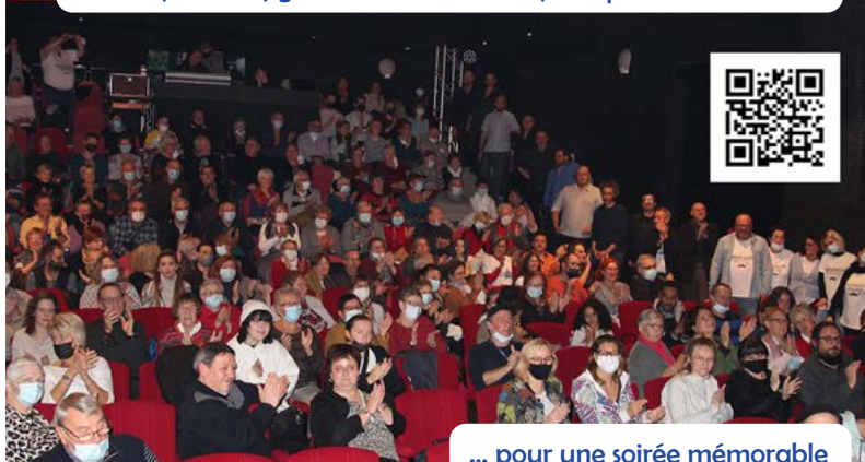
... pour une soirée mémorable