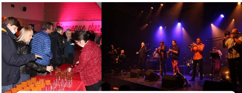
accueil, concert, gâteau d'anniversaire, fresque de souvenirs...

A l'occasion des 20 ans, la ville a aussi fait éditer un livre et commandé le film « Bienvenue chez vous ! » présenté lors d'un cinésandwich. Vous pouvez flashcoder le lien insérer dans le montage photos.