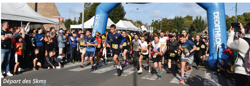
Départ des 5kms