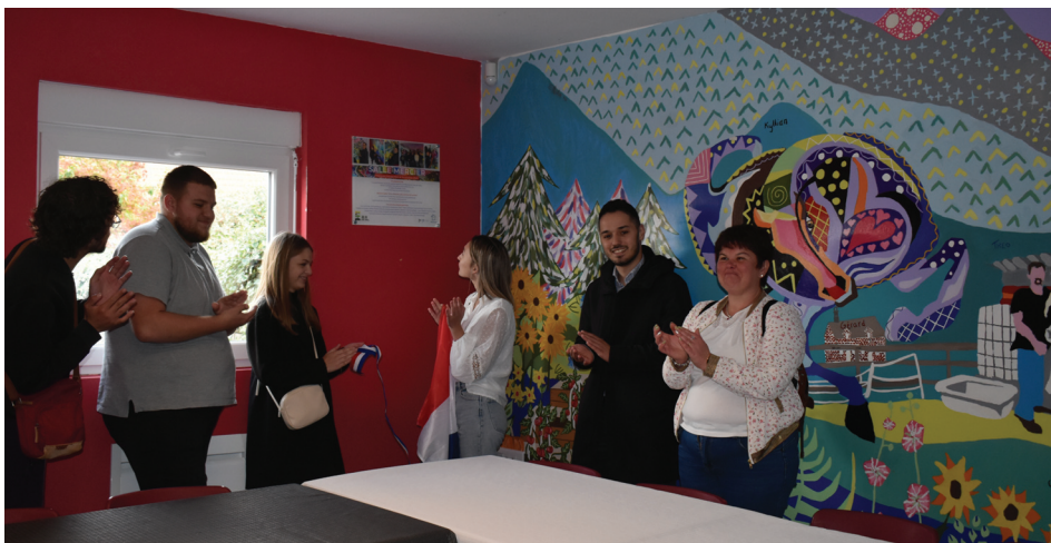
Dévoilement de la plaque de la salle Mercier

Durant trois semaines par groupes de 8, les jeunes ont rénové le bureau de Madame la Maire, la salle Mercier, la passerelle et un véhicule électrique des services