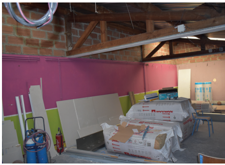
L'ancien local du javelot accueille désormais les Pompes Funèbres Municipales de Grenay, dont l'ouverture est prévue le 2 novembre. Les agents sont prêts

Encore félicitations aux agents des services techniques pour leur professionnalisme, leur efficacité, leur courage !! On sait pouvoir compter sur vous pour nos projets, et