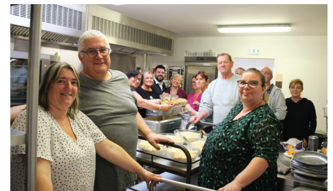
L'équipe de la commission et les agents du CCAS main dans la main pour la préparation du repas de clôture