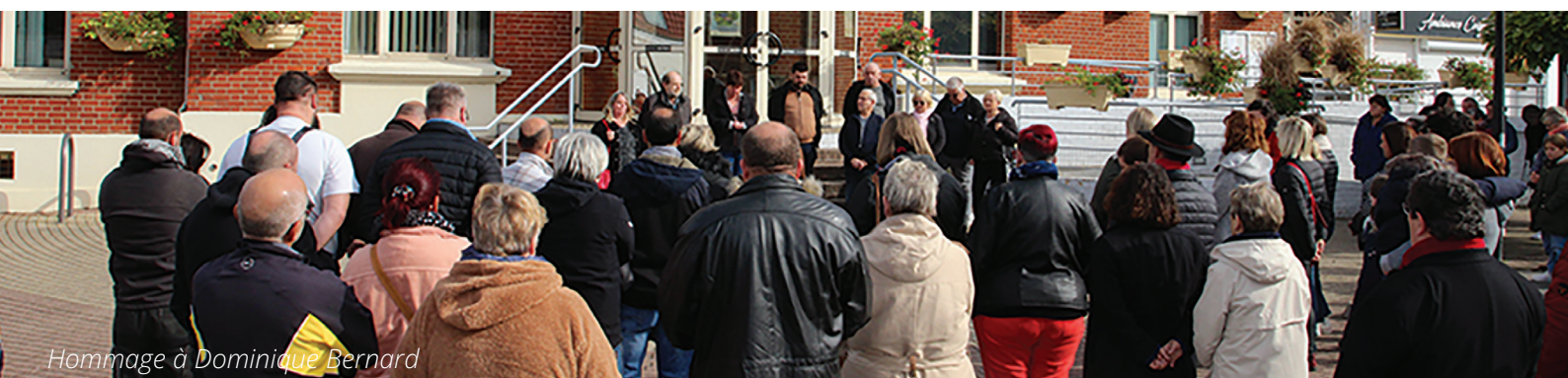
Hommage à Dominique Bernard