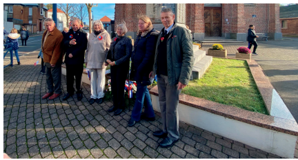
La délégation anglaise de Ruddington du Nottingham shire